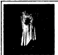
FRAUENFORMEN 2 SEXUALISIERUNG

Unser Wunsch, das Parlament möge in drei Minderheiten zerfallen — dann hätte der außerparlamentarische Kampf gegen Sozialabbau und Raketen die besten Bedingungen gehabt —, hat sich nicht erfüllt. Aber machen wir uns nichts vor: wußten wir nicht seit langem, daß sich eine progressive Entwicklung über die SPD hinaus nur bei Inkaufnahme einer zeitweiligen Stärkung der Rechten einleiten ließ? Gerade weil wir dies wußten, haben wir doch in den 70er Jahren Wahl für Wahl diese uns nur allzu gut bekannte Partei gegen das »größere Übel« unterstützt. Jetzt sind die lebensbedrohenden Probleme in Sichtweite, jetzt handelten viele von uns nach der Maxime, daß wer sich nicht in Gefahr begibt, darin umkommt. Helmut Schmidt hat natürlich vollkommen recht, wenn er den Machtverlust seiner Partei auch auf deren innere Auseinandersetzungen zurückführt. Die Existenz der Grün-Alternativen ist ein Produkt dieser Auseinandersetzungen, ein Produkt der Spaltung der linken »Volkspartei«. Weinen wir ihr trotz allem keine Träne nach. Wir sind durch ihr Ende nicht schwächer geworden — so schwach wie jetzt waren wir schon immer —, sondern nur hellsichtiger.